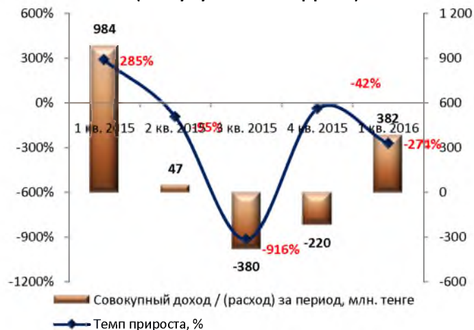
Динамика совокупного дохода / (убытка) за период (без кумулятивного эффекта)