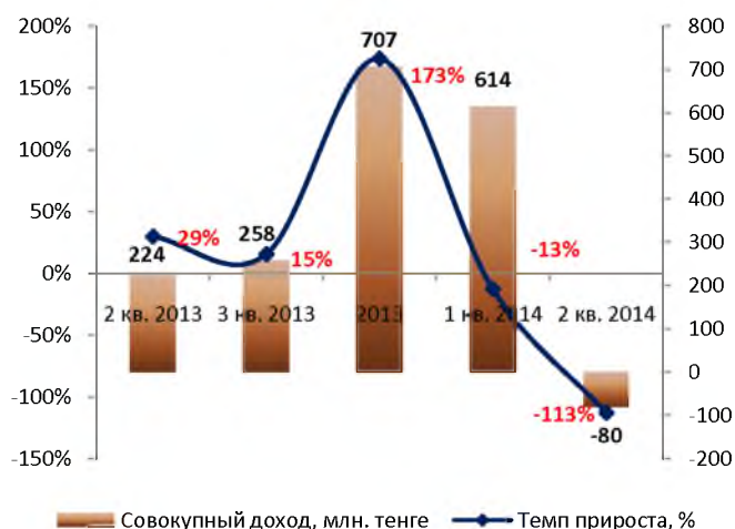
Динамика совокупного дохода (без кумулятивного эффекта)