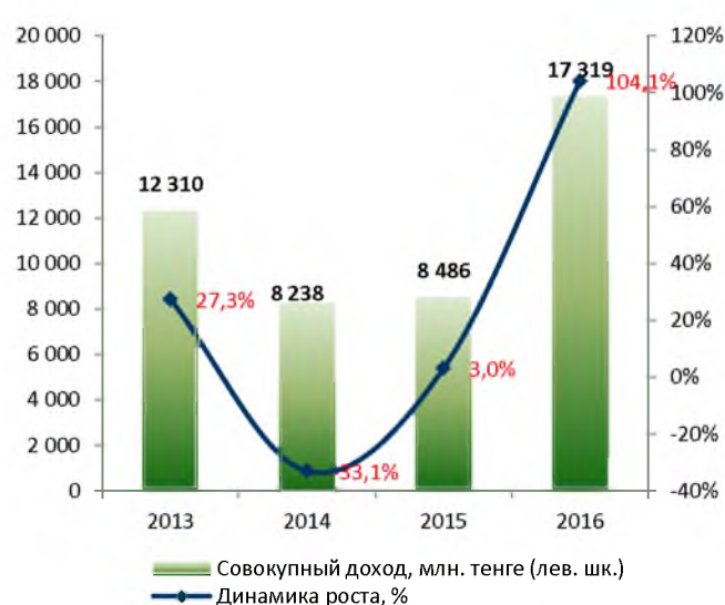
Динамика совокупного дохода