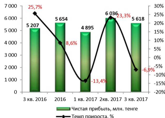
Динамика чистой прибыли (без кумулятивного эффекта)