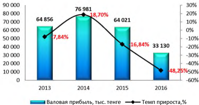
Динамика валовой прибыли

Незначительные расхождения между итогом и суммой слагаемых объясняются округлением данных.