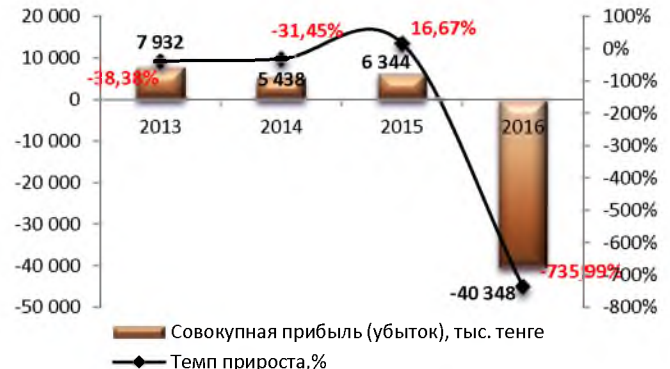
Динамика совокупной прибыли (убытка)