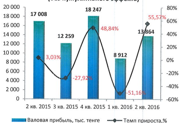
Динамика валовой прибыли (без кумулятивного эффекта)

Незначительные расхождения между итогом и суммой слагаемых объясняются округлением данных.