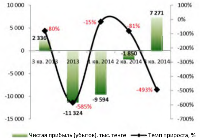
Динамика чистой прибыли (убытка) (без кумулятивного эффекта)