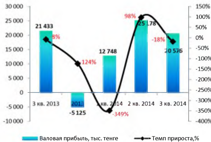
Динамика валовой прибыли (без кумулятивного эффекта)