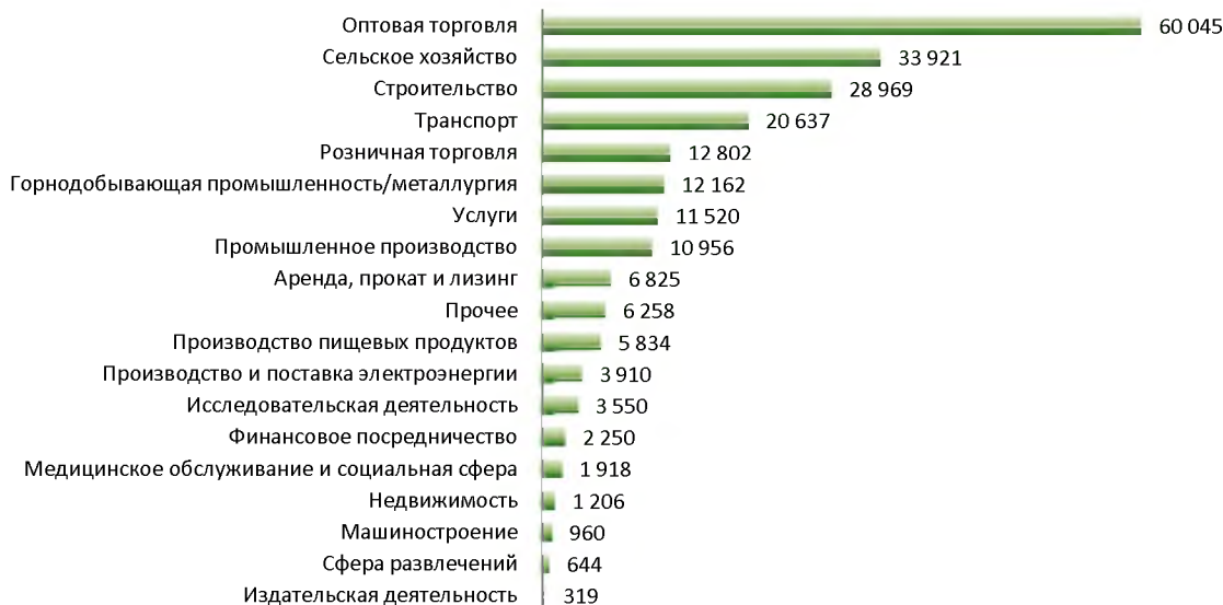
Кредиты, выданные розничным клиентам, (млн. тенге) по состоянию на 01.04.2014 г.