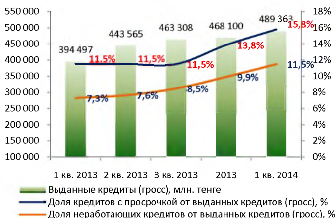
Качество ссудного портфеля