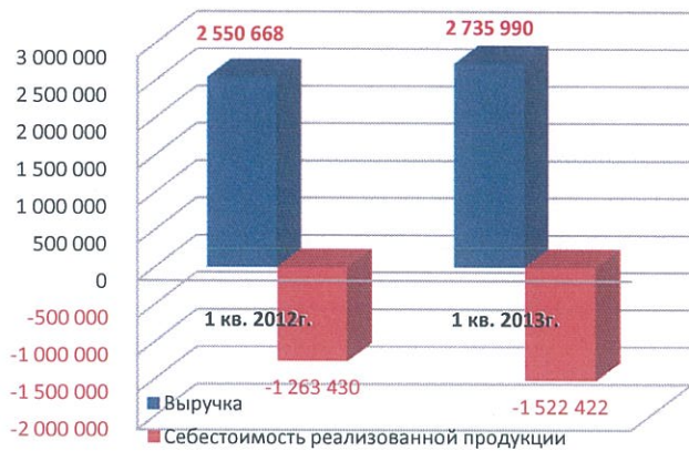
Динамика валовой прибыли, тыс. тенге

В целом в отчетном периоде на финансовый результат Эмитента негативно влияет увеличение расходных статей отчетности в результате, в основном, роста заработных плат, вероятно за счет увеличения количества сотрудников.