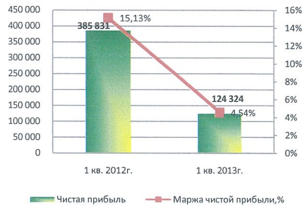
Динамика чистой прибыли, тыс. тенге