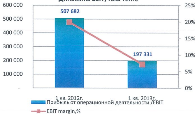
Динамика EBIT, тыс. тенге