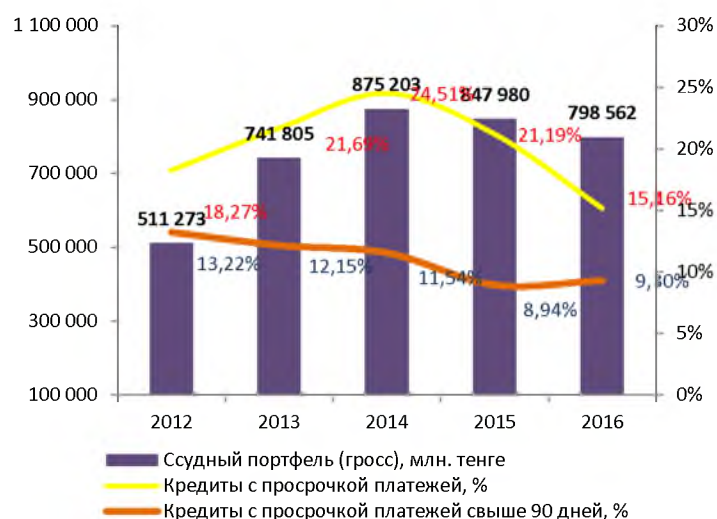
Качество ссудного портфеля (МСФО)