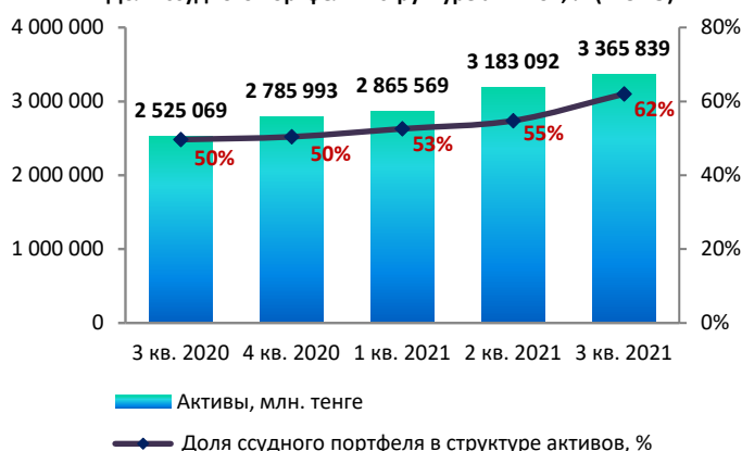
Доля ссудного портфеля в структуре активов, % (МСФО)