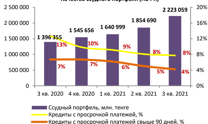
Качество ссудного портфеля (НБ РК)

Источник: Консолидированная финансовая отчетность Банка