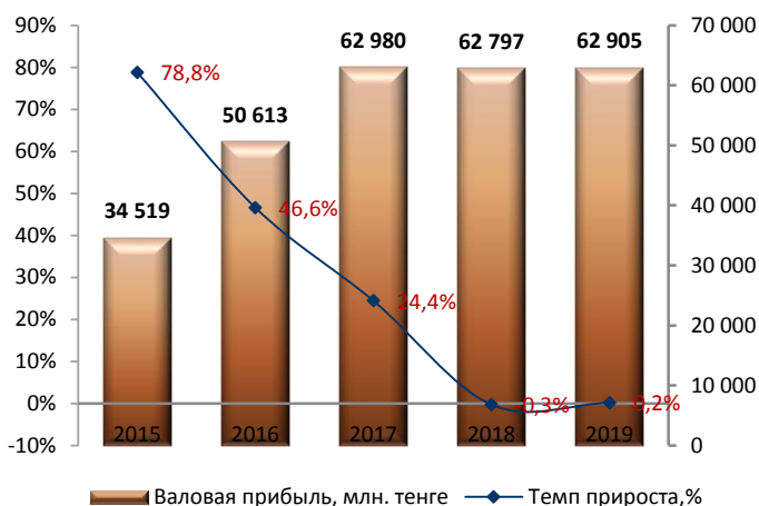
Динамика валовой прибыли