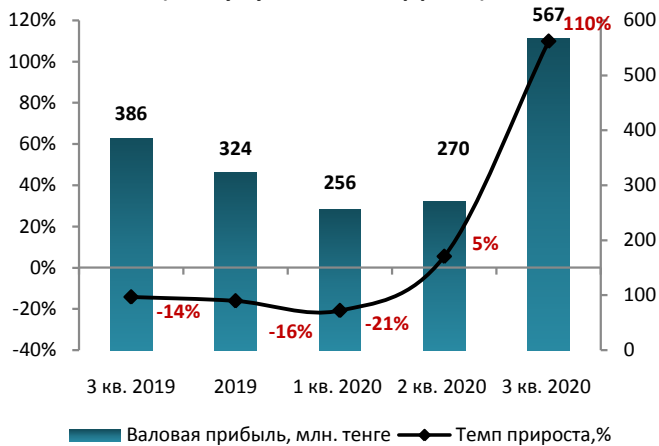
Динамика валовой прибыли (без кумулятивного эффекта)