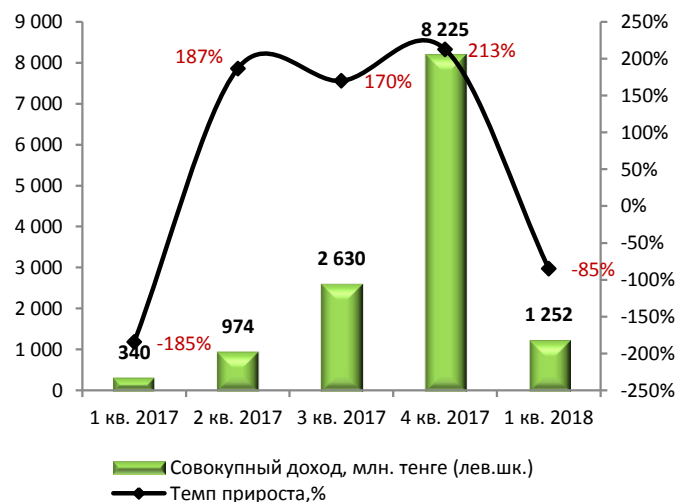
Динамика совокупной прибыли (без кумулятивного эффекта)