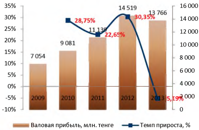
Динамика валовой прибыли