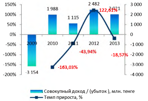
Динамика совокупного дохода