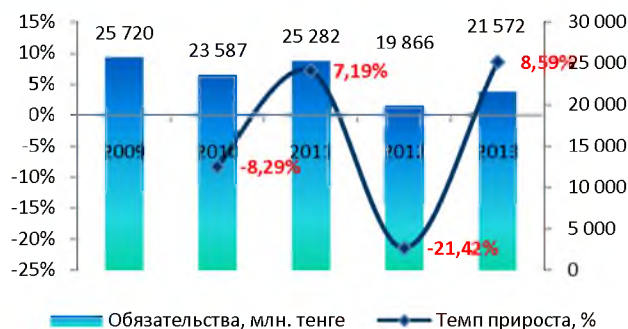
Динамика изменения обязательств