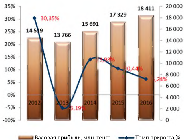
Динамика изменения валовой прибыли