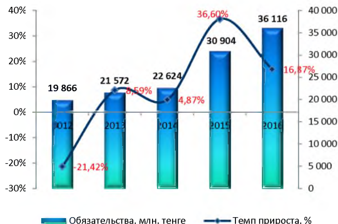
Динамика изменения обязательств