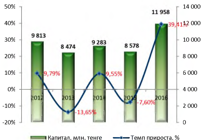
Динамика изменения капитала