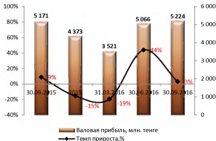
Динамика валовой прибыли (без кумулятивного эффекта)