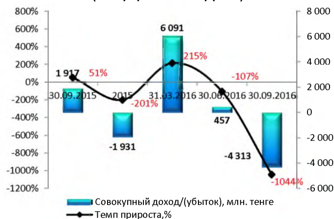
Динамика совокупного дохода/(убытка) (без кумулятивного эффекта)