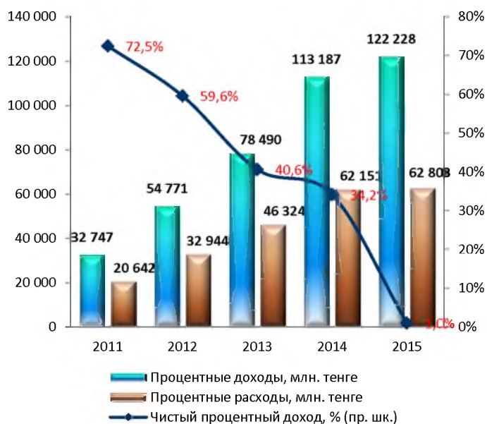
Динамика чистого процентного дохода