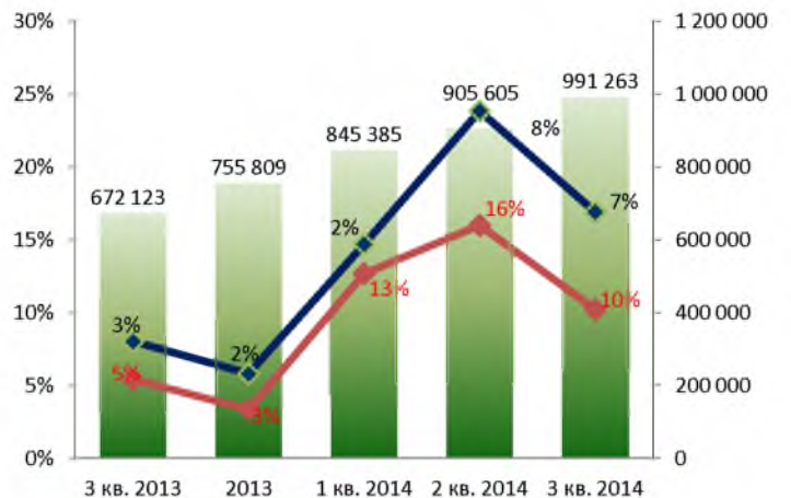
Качество ссудного портфеля