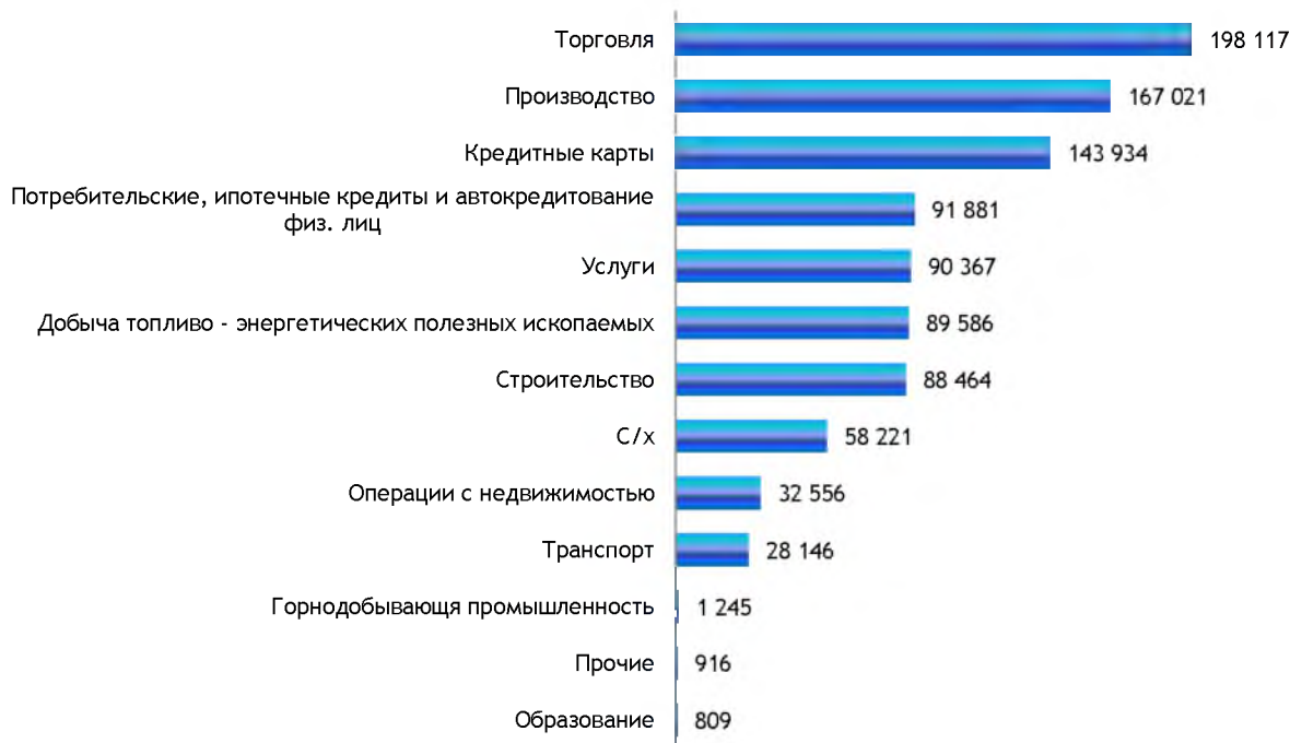
Кредиты, выданные клиентам, в разрезе отраслей ( млн. тенге) по состоянию на 30.09.2014 г.

Источник: Консолидированная финансовая отчетность Банка, CS