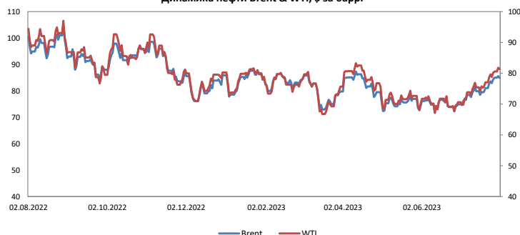
Динамика нефти Brent & WTI, $ за барр.

Цены на нефть снизились на фоне укрепления доллара США и в преддверии публикации данных по запасам сырой нефти. Следует также отметить, что давление на нефть оказали слабые данные по производственному сектору в Китае и Еврозоне. Нефть марки Brent снизилась на 0,8% до 84,9 долл. за баррель, а американская нефть марки West Texas Intermediate (WTI) - на 0,5% до 81,4 долл.