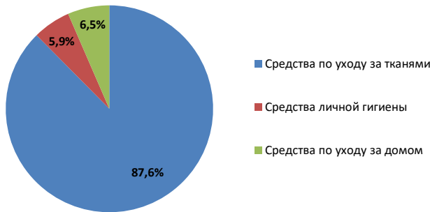
Выручка по сегментам за 2019 г.