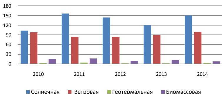
Инвестиции в возобновляемую энергию в мире, млрд. долл. США